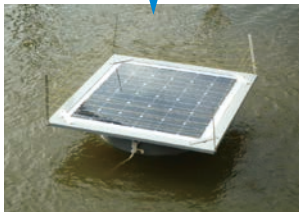
ソーラー水浄化装置